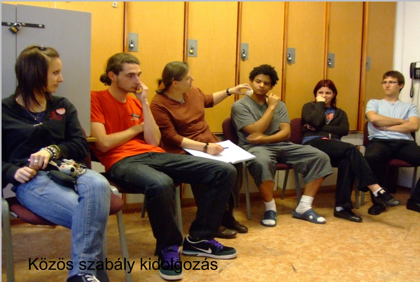
Közös szabály kidolgozás